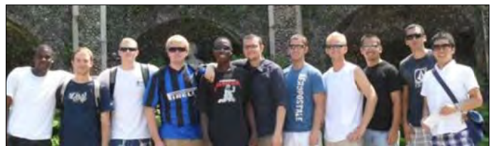
トリノ研修(イタリア)にてクラスメートと

その際、事前に登録することを忘れないようにしてください。事前に登録していない場合は、入場に時間がかかってしまいます。会場へは時間に余裕を持って行きましょう。かなりの列ができます。イベントは 3 日間とホームページに掲載されていますが、イベント 3 日目はほとん