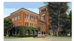
University of Southern California